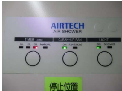
エア吹き出し及びタイマー機能OK